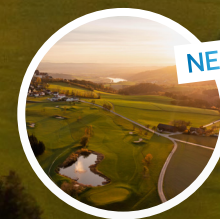
Golf Club Maria Taferl Wachau