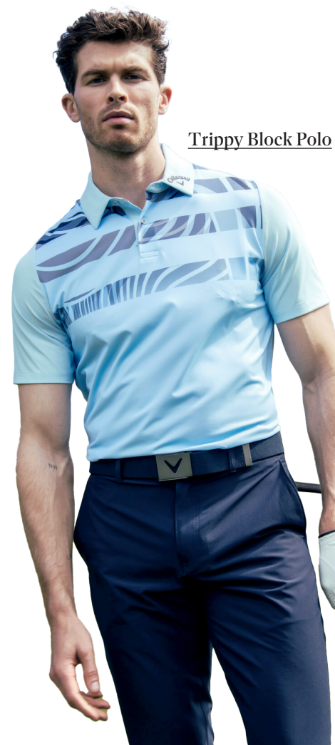
Trippy Block Polo