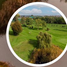
Golfclub Marco Polo Vienna