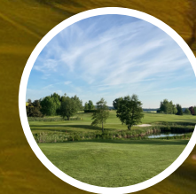
Diamond Club Ottenstein