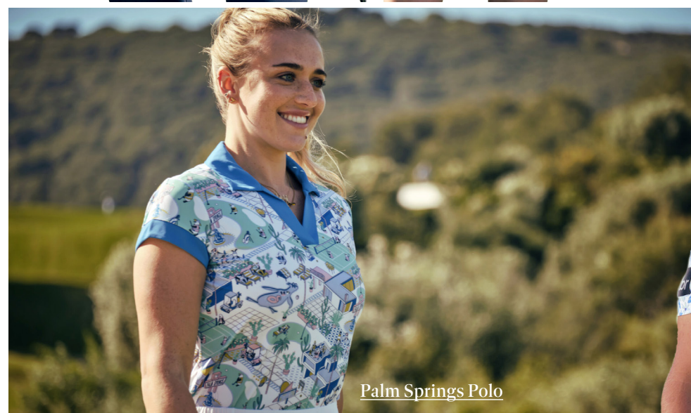
Palm Springs Polo