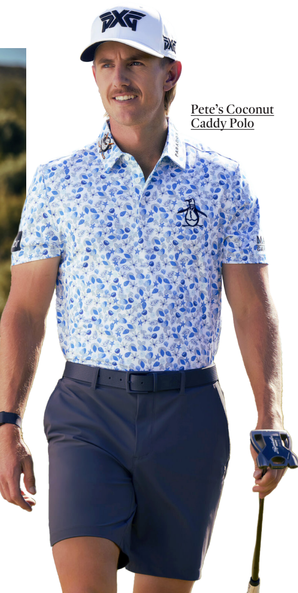
Pete's Coconut Caddy Polo