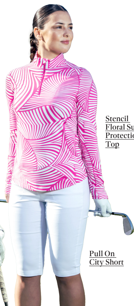
Stencil Floral Sun Protection Top